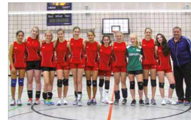
Volleyball-Mädchen U 18