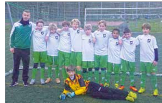
D 2 - Junioren