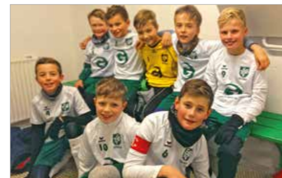
E 2 - Junioren

Die E 4 wurde in die zusätzlich gebildete Gruppe eingeteilt, um hier möglichst nicht so ambitionierte Gegner zu bekommen. Leider waren letztlich nur 5 Teams in dieser Staffel und die E 4 hatte somit nur 4 Spieltage. Man hat die Vorrunde mit 2 Siegen und zwei Niederlagen abgeschlossen und das Hauptziel erreicht. Alle Kinder durften an Spieltagen teilnehmen und hatten riesigen Spaß.