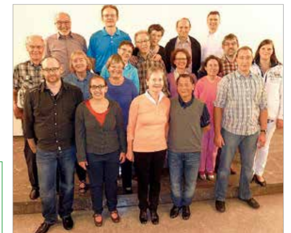
Tanzen Gruppe Mo. I, im November 2015