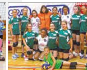
Volleyball-Mädchen U 16