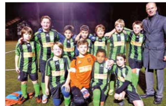
D 3 - Junioren