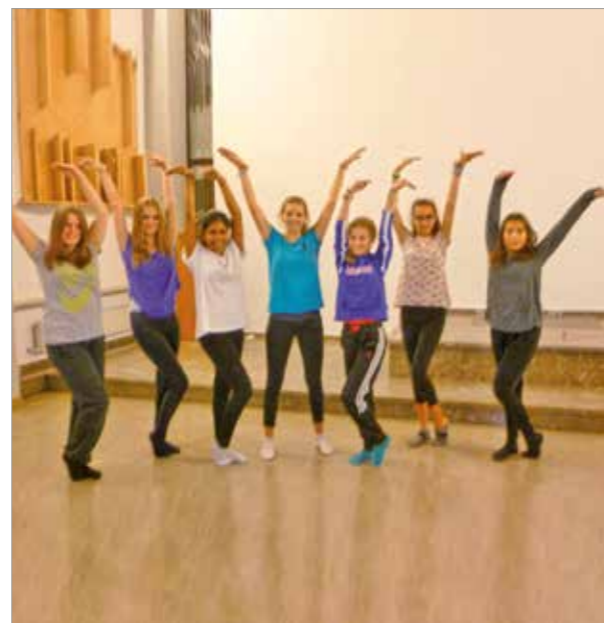
Tänzerinnen Gruppe III