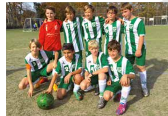
E 1 - Junioren

Toll ist, dass bei den E - Junioren vor der Saison nach Rücksprache mit dem Verband eine leistungshomogene Einteilung der 19 Staffeln vorgenommen wurde. In der Rückrunde orientiert der Staffelleiter die Einteilung auch wieder an den Ergebnissen der Vorrunde. Somit sind alle Mannschaften eigentlich nie unter- oder überfordert.