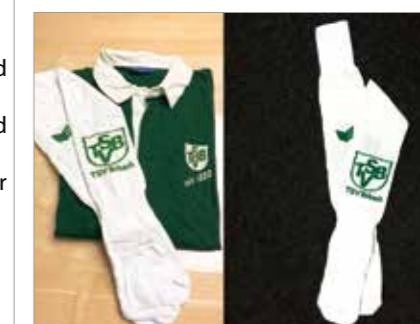
Unsere TSV-Werbemittel sind erhältlich unter: sponsoring@tsv-birkach.de