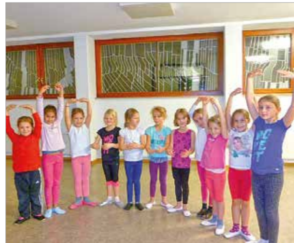
Tänzerinnen Gruppe II