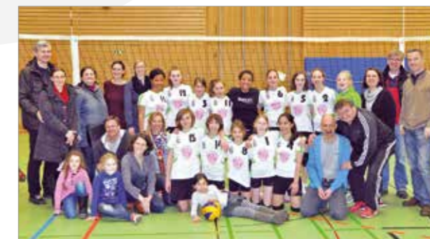
Volleyball-Mädchen U 14