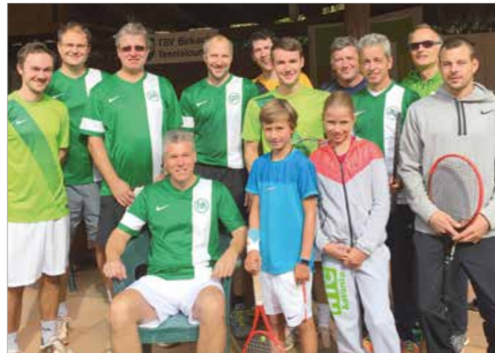
Teilnehmer der Vereinsmeisterschaften

Die Platz -Putzete zur Saisoneroöffnung wird am 16. und 23. April stattfinden, damit bei gutem Wetter ab Ende April auf den Sandplätzen gespielt werden kann. Traditionell wird die Sommersaison im Anschluss mit dem Bändelesturnier Anfang Mai eröffnet. Die Verbandsspiele werden großteils im Juni und Juli ausgetragen. Ende September werden wieder die Vereinsmeisterschaften zum Abschluss der Saison ausgetragen.