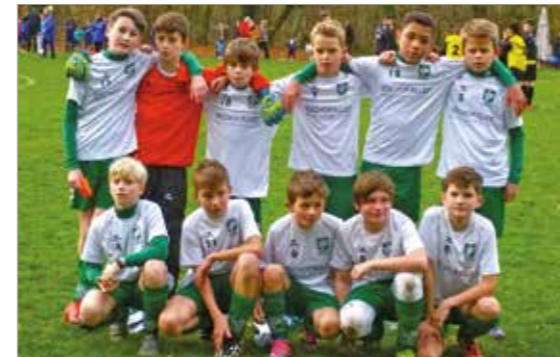
D 1 - Junioren

Für die Saison 2015/2016 startete die U 13 mit insgesamt 40 Spielern der Jahrgänge 2003 und 2004. Mit dem Ziel, jeden Spieler auch an Meisterschaftsspielen teilnehmen zu lassen, hat der TSV erstmals drei D- Jugend Teams beim WFV für die Punktrunde angemeldet. Dabei musste sich der jüngere Jahrgang zunächst mal auf das größere Spielfeld einstellen. Hinzu kam die Umstellung vom Kinder- zum Jugendfußball, mit erweiterten Fußballregeln wie Rückpassregel zum Tor-spieler und Abseitsregel und erstmals mit offiziellen WFV-Schiedsrichtern. Die Teilnahme aller Teams an der Punktrunde stellte das kleine Trainerteam, bestehend aus den verantwortlichen Trainern Roberto Accardi und Steve Nteveros , der als junger hochklassiger Spieler in unserer 1. Mannschaft spielt und seit dieser Saison die D 2 mit großem Engagement übernommen hat, vor Herausforderungen. Der Spielbetrieb der D 3 kann nur aufrecht erhalten werden durch die dankenswerte Unterstützung der Spielereltern (Claudia Schmid, Muhamed Mourad und vor allem Joachim Rudolf).