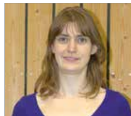
Kursleitung: Andrea Dosch