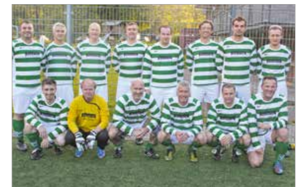
Alte Herren ab 30