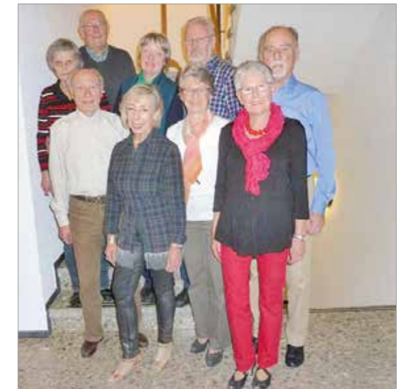
Tanzen Gruppe Belle - Epoque

Jahresterminplan 2016 der Tanzsportabteilung des TSV Birkach Die einzelnen Termine werden im Februar in der Abteilungsversammlung festgelegt und anschließend auf der Homepage der Tanzsportabteilung bekannt gegeben.