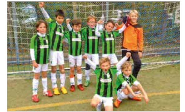
E 3 - Junioren

Sofern sich noch ein verantwortlicher Betreuer für die E 4 findet, werden wir wieder mit 4 Teams in die Rückrunde gehen. Sollte sich hier niemand finden, werden wir nur mit der E 1, E 2 und E 3 am Spielbetrieb teilnehmen. Beim Mittwoch-Training kümmern sich alle anwesenden Trainer immer um alle anwesenden Kinder. Freitags soll mehr Wert auf ein teamgeschlossenes Training und die gezielte Spielnach- und Vorbereitung gelegt werden. Der Jahrgang 2005 ist mit fast 30 Kindern breit aufgestellt und wird dann auch schon langsam auf das größere D - Jugendfeld vorbereitet. Im Bereich der 2006er kann die Mannschaft insbesondere im Hinblick auf die Aspekte Kondition und Ballorientierung sehr gut mithalten. Es kommen alle Spieler regelmäßig zum Einsatz in der E 3 und E 4. Es zeigt sich die knappe Personalressource des Jahrgangs bei Spielerausfällen. Es ist für uns sehr wichtig, weitere Spieler für den Jahrgang 2006 zu gewinnen: Ein Probetraining ist jederzeit gerne möglich!