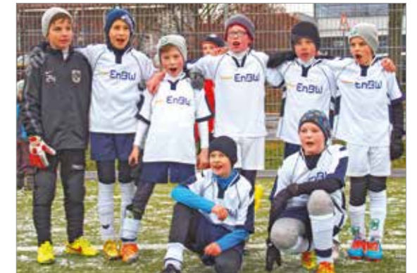
E 4 - Junioren