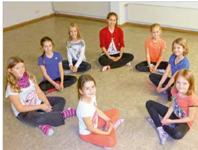
Tänzerinnen Gruppe I

In unseren Kinder-Dancing-Gruppen sind alle Kinder und Jugendliche herzlich willkommen, die Spaß und Freude an der Bewegung haben. Schwerpunkte und Inhalte unseres Unterrichts sind: Balance, Elementare Jazztanzgestaltung, Koordinationstraining, Körperhaltung, Musikalität, Präsentationsfähigkeit, Rhythmikschulung, und korrekte Bewegungsausführung. Das rhythmische Gefühl wird mit unterschiedlichen methodischen Mitteln intensiviert und so wird über Grundformen zum Jazz-Dance und Modern Dance hingeführt. Das tänzerische Können wird in einer Choreographie zusammengeführt und bei besonderen Anlässen und Sonderauftritten gezeigt.