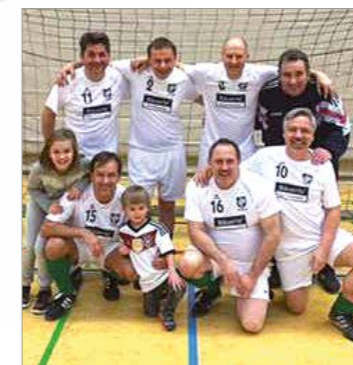
Alte Herren ab 50

Vorschau Die Hallensaison beginnt und damit die Zeit der beliebten Hallenturniere.